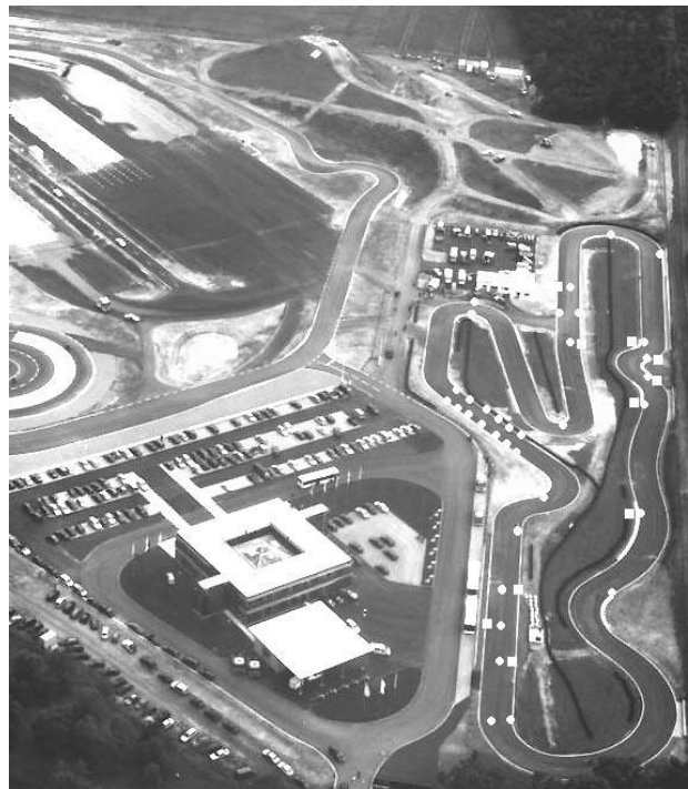
Ansicht RSG Kartbahn Embsen