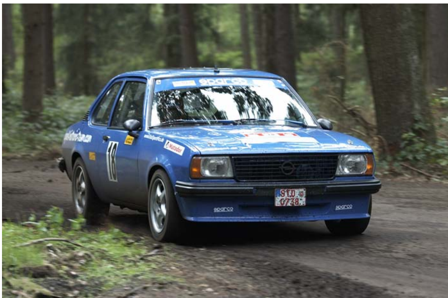
Mit frischen Farben zum Klassensieg Stamm / Müller